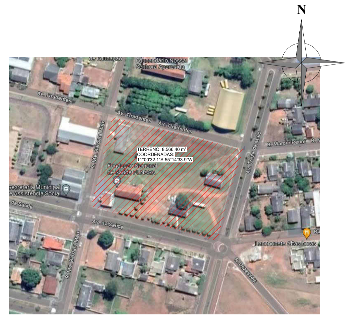
IMAGEM SATÉLITE 1 : 200